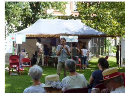
Conférence sur la déshydratation du nourrisson, espace santé, festival Lafi Bala 2015

Tous les deux ans, le comité de jumelage du CHMS organise un « espace santé » qui propose des ateliers et des discussions autour de la santé en Afrique.