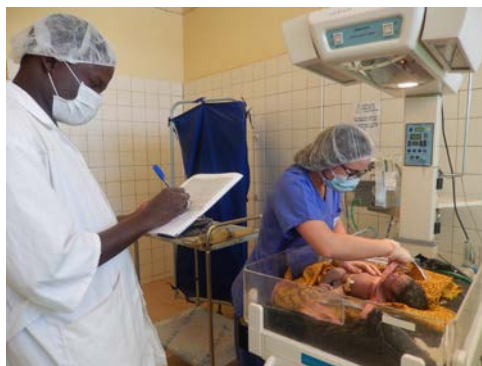
Mission obstétrique Nord-Sud 2015