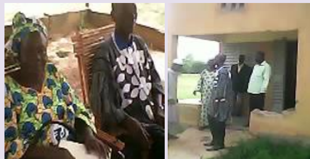
Ci-dessus, respectivement de la gauche vers la droite, la 2 ème Adjointe au PDS, le Secrétaire général de la Mairie et les autres membres de la délégation municipale en pleine visite dans les locaux du centre secondaire d'Etat civil de Soumyaga

général et des membres de la Direction de l'Administration Générale (DAG) de la mairie de Ouahigouya a effectué des tournées de sensibilisation pour le choix des OECD dans les quatre villages de Bogoya, Sissamba, Soumyaga et Youba en vue de l'ouverture et du fonctionnement des centres secondaires locaux d'état civil. A l'issue des séances au cours desquelles les délégations ont été localement consignées, une visite des locaux destinés aux services de l'Etat civile a été organisée.