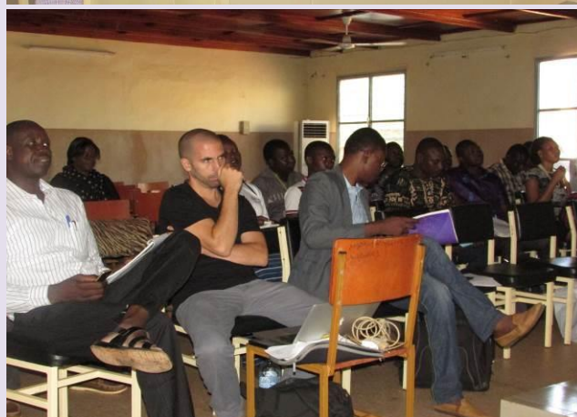
Ci-dessus, une vue des participants à l'atelier

En attendant le financement des grosses œuvres, conformément aux résultats des études, la nécessité d'une mise en œuvre pratique d'actions culturelles au niveau de la MJCO, a exigé un nouvel examen des locaux de ladite institution. Comme constat, il s'avère primordial d'effectuer des travaux pour le renforcement de l'ensemble des ouvertures (portes et fenêtres) de la salle de spectacle afin de garantir un minimum de sécurité du matériel et des équipements reçus de la ville de Chambéry. En sus, une centaine de sièges méritent d'être réparés pour mieux accueillir les spectacles.