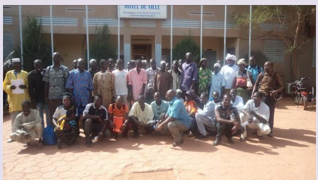
Ci-dessus, la photo de famille prise après l'atelier