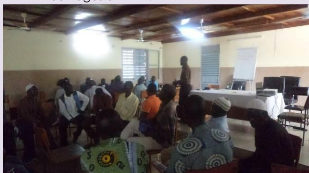
Ci-dessus un angle de vue de la salle lors de l'atelier