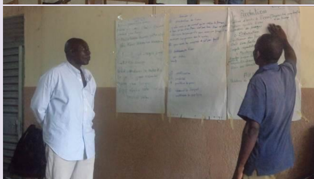
Ci-dessus, respectivement de haut en bas, une séance de travaux de groupe et de restitution lors de l'atelier