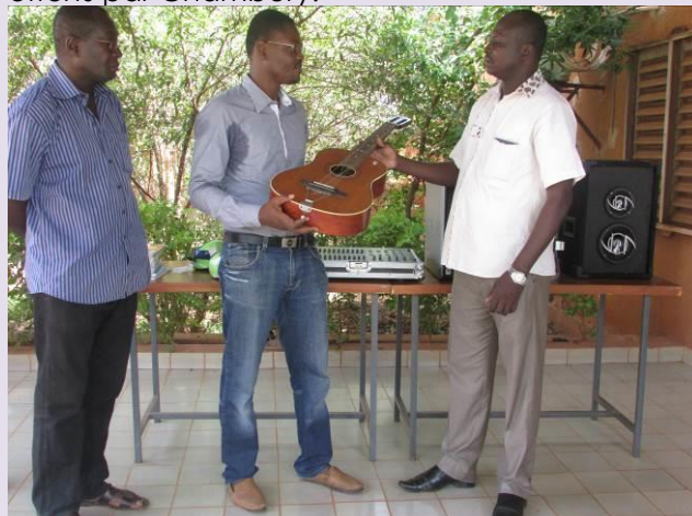
Sous le regard admirateur du DAFB, le Chef de projet MJCO reçoit des mains du PDS une guitare à titre symbolique

Pour la circonstance, le PDS a fait le déplacement dans chacun des services concernés par cette remise. C'est ainsi que les premiers responsables de ces structures ont pu recevoir des mains du PDS les équipements offerts par Chambéry.