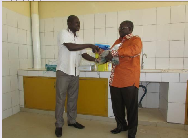
Ci-dessus, le DG du CHR recevant des mains du PDS, un échantillon du matériel destiné au CHR de Ouahigouya.

Tout comme la MJCO, le CHR de Ouahigouya a reçu, dans le cadre de la coopération hospitalière, une grande quantité de matériel composé essentiellement de consommables médicaux.