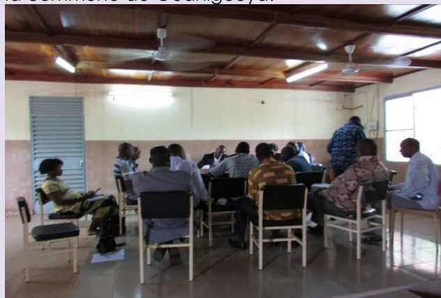
Ci-dessus, une vue partielle de la table de concertation entre la délégation de Boussé et les principaux acteurs en charge du recouvrement à Ouahigouya

Le 6 août 2015, une délégation de la DS communale de Boussé a effectué une mission d'échanges et de partages d'expériences avec les services techniques en charge du recouvrement des taxes et impôts au niveau de la commune de Ouahigouya.