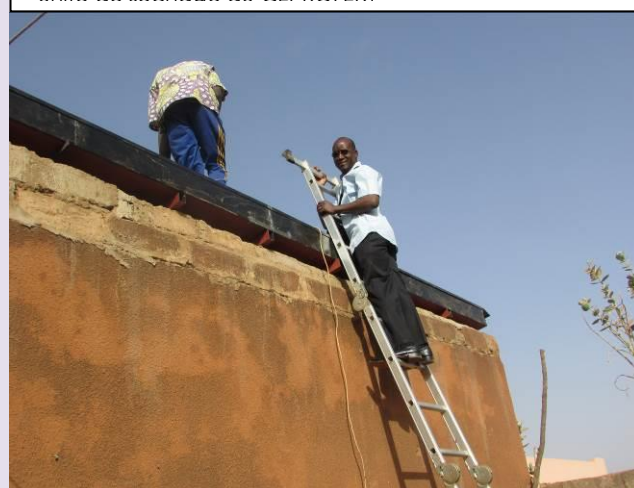
Ci-dessous, le coordonnateur en pleine supervision des travaux lors des opérations d'assemblage et la pose des composantes du dispositif collecteur solaire au profit de l'unité de séchage du CEPROFEM

En somme, pour la pose en toute sécurité du dispositif du collecteur solaire, la charpente du bâtiment support a été renforcée avec des IPN et quelques travaux génie civil.